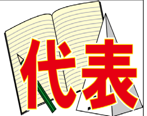
いいんかい 委員会