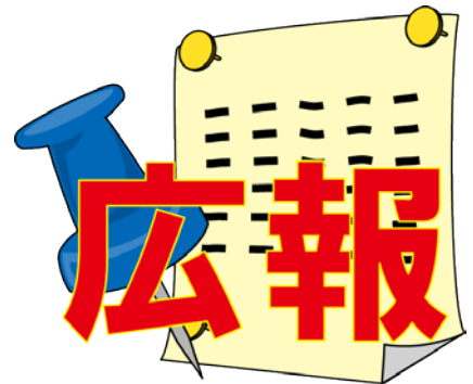
いいんかい 委員会