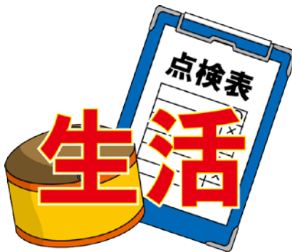
いいんかい 委員会