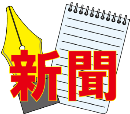
いいんかい 委員会