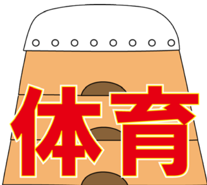
いいんかい 委員会