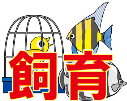
いいんかい 委員会