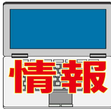
いいんかい 委員会