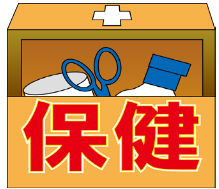
いいんかい 委員会